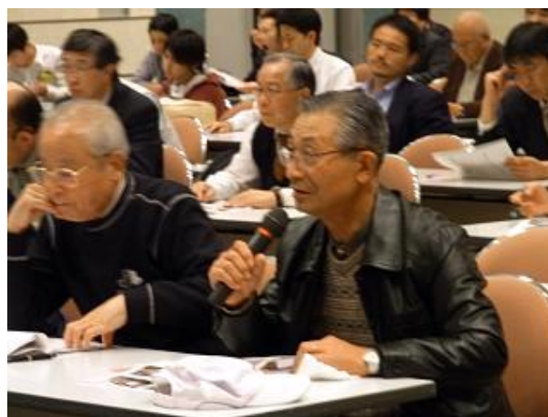
写真3 会場からの質疑の様子