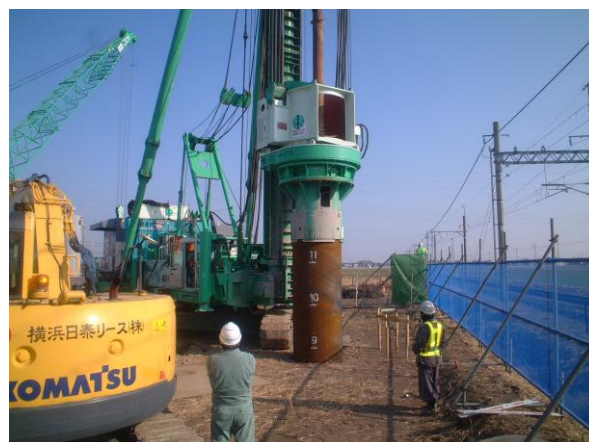
写真 1 東武跨線橋での鋼管杭施工状況