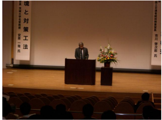
写真2 千葉県建設技術協会会長のごあいさつ