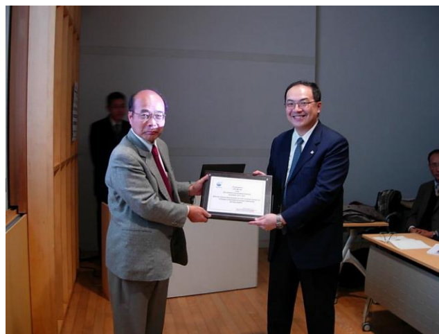
写真 2 感謝状贈呈の様子