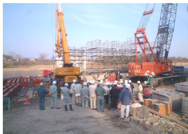
写真 2 利根川新橋（仮称）P4 橋脚でのケーソン工事状況