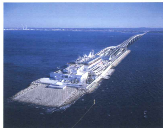
シールドと橋梁で東京湾を横断するアクアライン