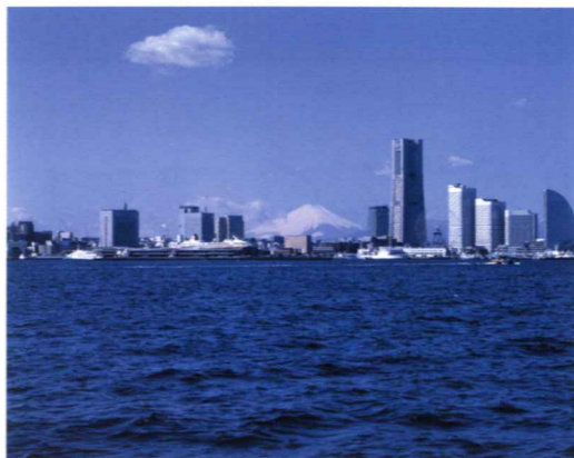
その火山灰が広く関東平野を覆っている富士山