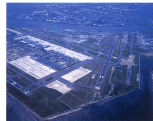
4番目の滑走路建設の検討が進む羽田空港 (護岸外側の干潟に多様な生物が生息している)