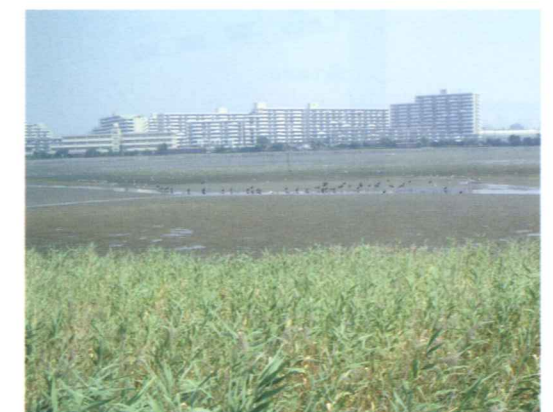
各種の渡り鳥が集まる谷津干潟 (自然環境と人間の生活空間が共生している)